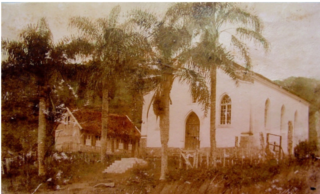
Primeira Residência Franciscana e Igreja Matriz de Teresópolis. Fotografia de 1892.