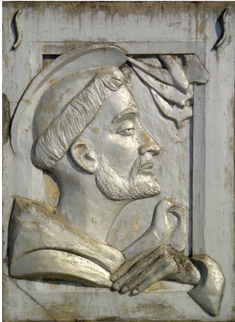
Detalhe do Monumento erguido em Teresópolis em comemoração ao primeiro centenário da chegada dos frades restauradores. Fotografia de 2004. ATJ.