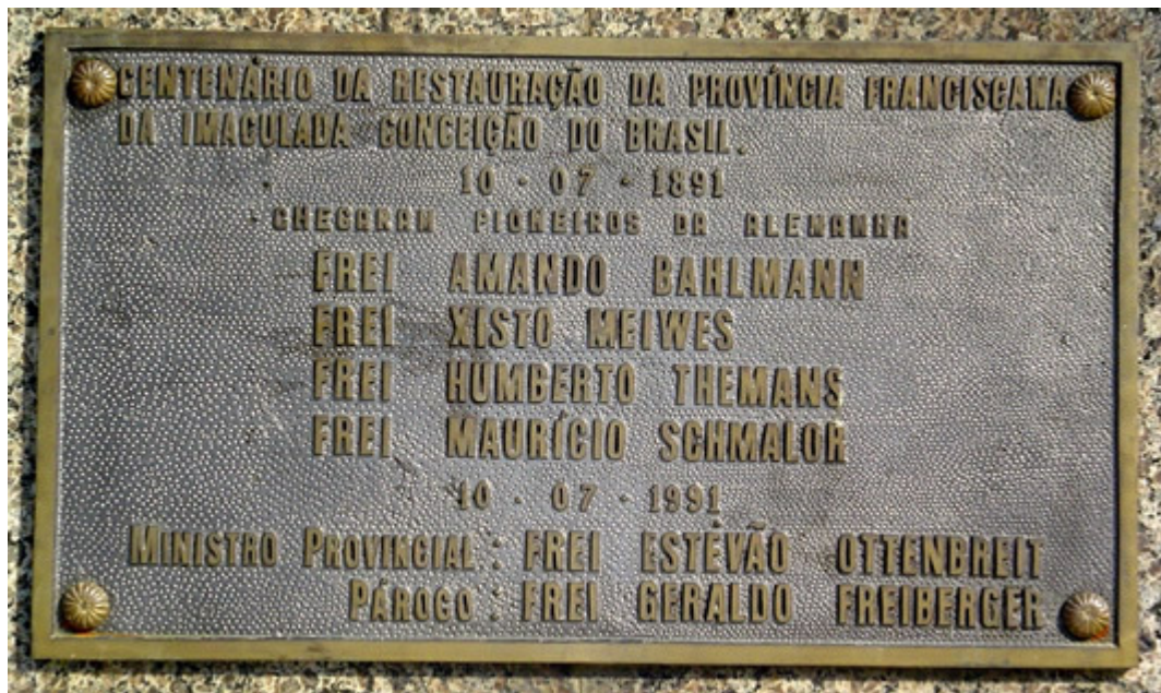
Placa afixada no Monumento erguido em Teresópolis em comemoração ao primeiro centenário da chegada dos frades restauradores. Fotografia de 2004. ATJ.