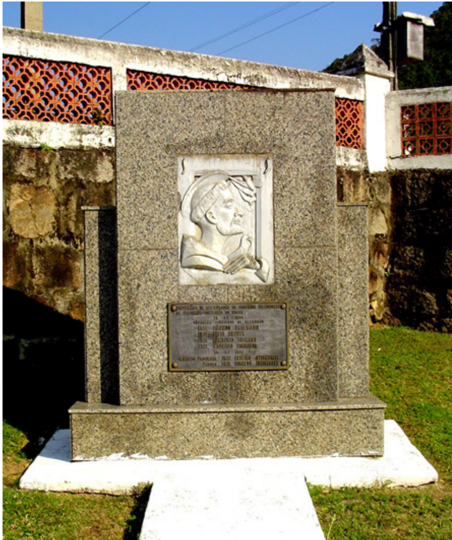
Monumento erguido em Teresópolis em comemoração ao primeiro centenário da chegada dos frades restauradores. Fotografia de 2004. ATJ.