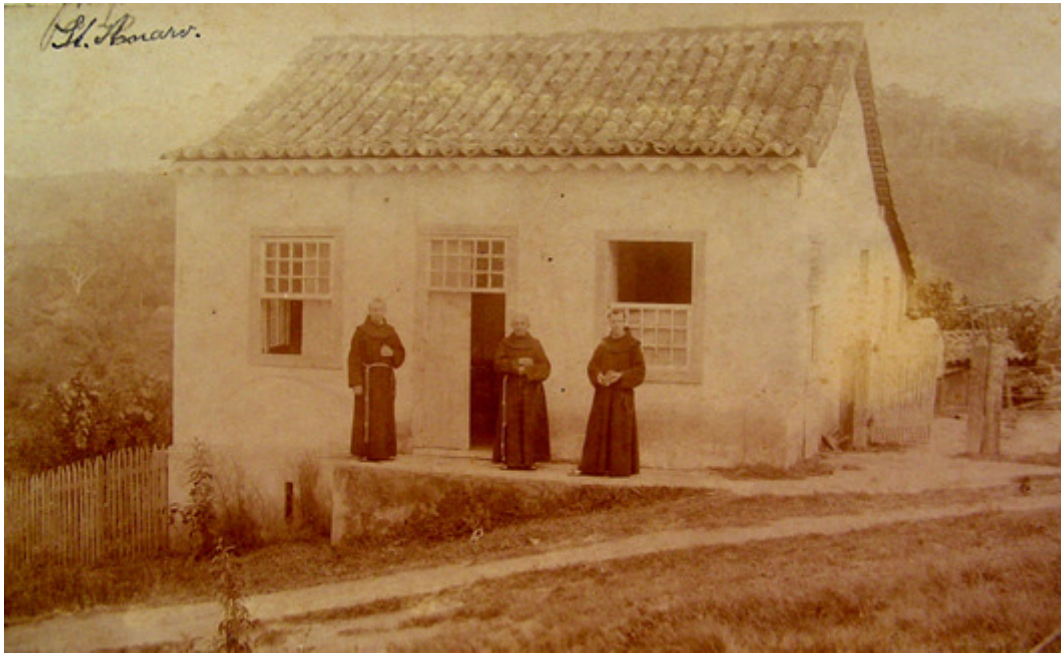
Primeira Residência Franciscana em Santo Amaro do Cubatão, hoje da Imperatriz. Fotografia de 1901. APFICB.