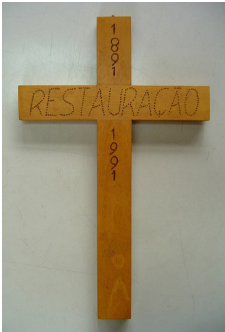
Cruz da Restauração da Província Franciscana da Imaculada Conceição do Brasil utilizada em Teresópolis nos festejos alusivos ao primeiro centenário da chegada dos franciscanos, em 10 de julho de 1991. Fotografia de 2004. APFICB.